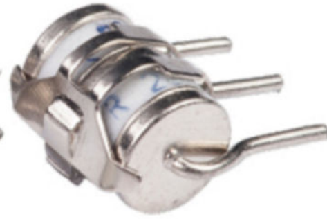
Arrester 3 Kutuplu Fail Safe