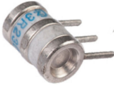
Arrester 3 Kutuplu 230V