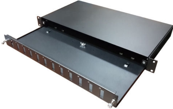
Rack Tipi F/O Panel